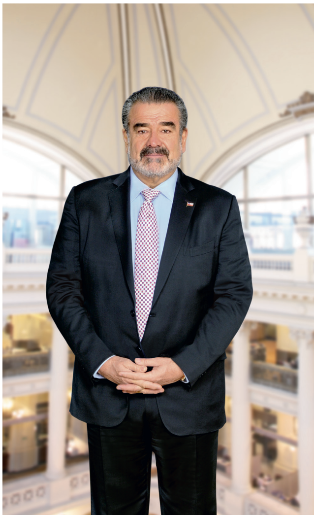
Andrónico Luksic Craig | Presidente del Directorio